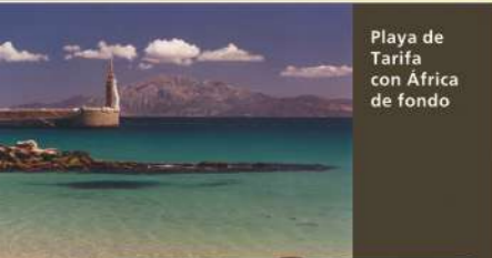
Playa de Tarifa con África de fondo

Fue en las dunas de Punta Paloma donde se inició el rodaje en Andalucía. Contrariamente a lo que suele ocurrir en la zona, no sopló nada de viento. De todas formas, la productora tenía previsto que, en el caso de éste fuese excesivo, se trasladarían al histórico Castillo de Guzmán el Bueno, en el casco urbano, para continuar el rodaje.