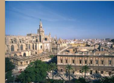
Catedral y Giralda en Sevilla