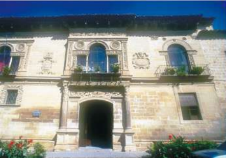
Ayuntamiento de Baeza

Las escenas de duelos callejeros, tan características de las novelas de Pérez-Reverte, se desarrollaron en algunas de las calles del casco histórico de Baeza. Entre las transformaciones más llamativas de la ciudad, que acogió al equipo de rodaje durante una semana, destaca la recreación de un mercado popular del Siglo de Oro en la calle Juan de Ávila, lugar donde se levanta la antigua universidad. Baeza, cuenta además con múltiples callejuelas que sorprenden por sus portadas y sus escudos heráldicos. También ofrece variadas y rutas turísticas como la del Renacimiento o los Castillos.