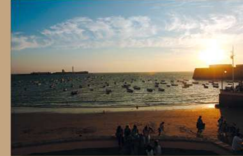
Atardecer en La Caleta