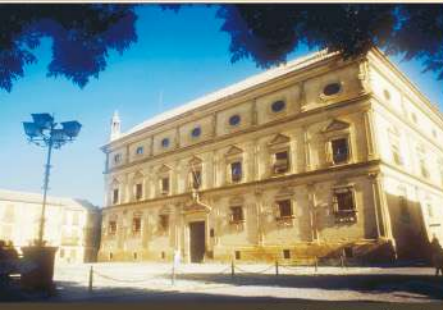
Casa Palacio en Úbeda