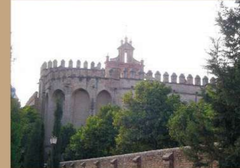
Monasterio de San Isidoro del Campo